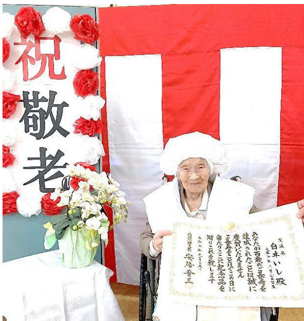
祝 100 歳