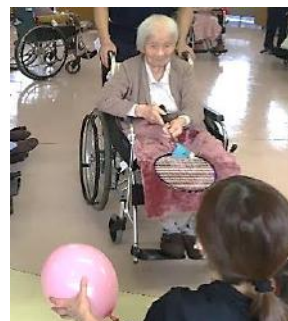
ケツ圧測定が待っています！