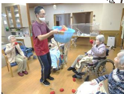
玉入れに元気に参加しました！