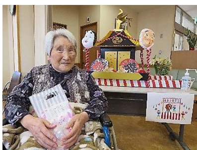
職員手作りの神輿が登場、本物みたいです！

会議室に装飾をし、縁日の雰囲気を感じていただけるよう、食べ物やゲームコーナーを用意し、園熟さんに楽しんで頂ける企画をしました。また感染予防も考えて各ユニットの園熟さん1人ずつ対応させていただきました。お雛子の音楽が流れると、園熟さんにも笑顔が見られ、輪投げやヨーヨー釣りに参加し、フランクフルト、焼きそば、アイス、職員特製饅頭等々、好きな物を選び召し上がられ、大変喜ばれていました。