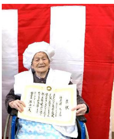
祝 101 歳