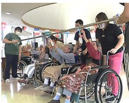
人気のパン食い競争、頑張って！