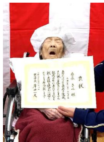
祝 102 歳