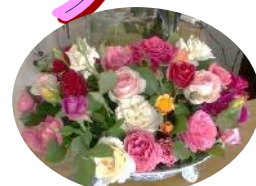
職員が育てたバラです！

発行者 特別養護老人ホーム 東湖園 住所 銚田市安房1670-12 TEL 0291-33-6700 FAX 0291-33-3837 URL http://www.toukoen.com