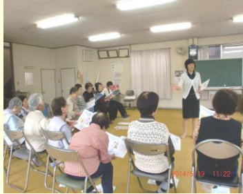
借宿老人クラブの皆様