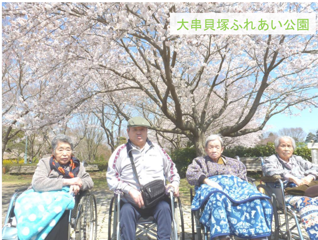
大串貝塚ふれあい公園

伝説の巨人「ダイダラボウ」の居る大串貝塚ふれあい公園（水戸市）へ出かけました。「ダイダラボウ」は海まで手を伸ばし貝を採って食べたという伝説があるくらい、とても大きくて園熟さんもびっくりしていました。公園の桜や雪柳が丁度見頃で、とても綺麗に咲いていて素晴らしかったです。お天気にも恵まれ、久しぶりの遠出を楽しめました。（本館）