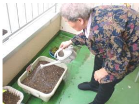
水やりが大事です！