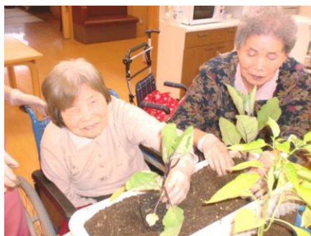
ナスやトマト、ピーマンの苗を植えました。「収穫が待ち遠しいね！」と入所者同士の会話もはずみます。