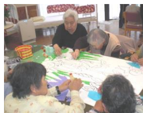
折り紙やお花紙を使ってアジサイやあやめを作り玄関に飾りました。お花紙は薄いため破らないように広げるのが大変だったようです。とても綺麗にできました。