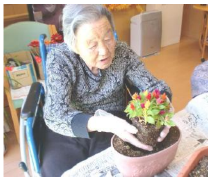
「長く咲いて楽しませてね！」思いを込めて優しく植えました。花のある暮らしは素敵ですね！