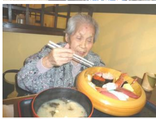
お昼はイエローポートで