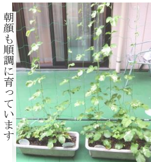
朝顔も順調に育っています