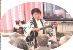
唄や踊りは園熟さんの知っている曲も多く一緒に口ずさむ姿が見られ、園熟さんも大変喜ばれていました。北浦舞踊の皆様、楽しい時間をありがとうございました。